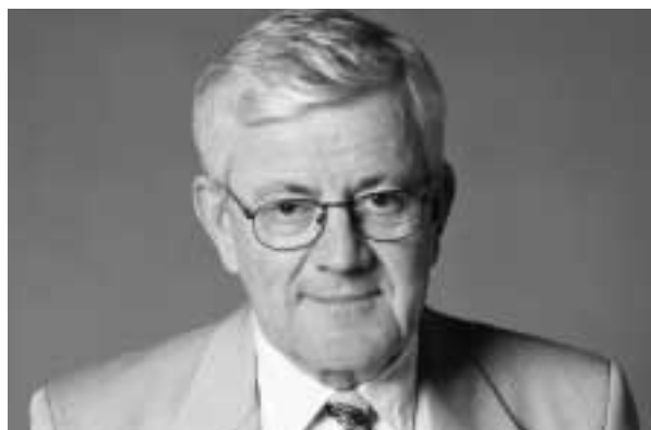
Lars Engqvist Socialminister

planen är genomförd. Vi vet att allt kan inte ske omedelbart men vi vill tydligt visa att handikappolitiken ska ha en ny inriktning. Och att ansvaret är gemensamt. Det är bara med ett gemensamt ansvar vi kan bygga ett samhälle för alla.