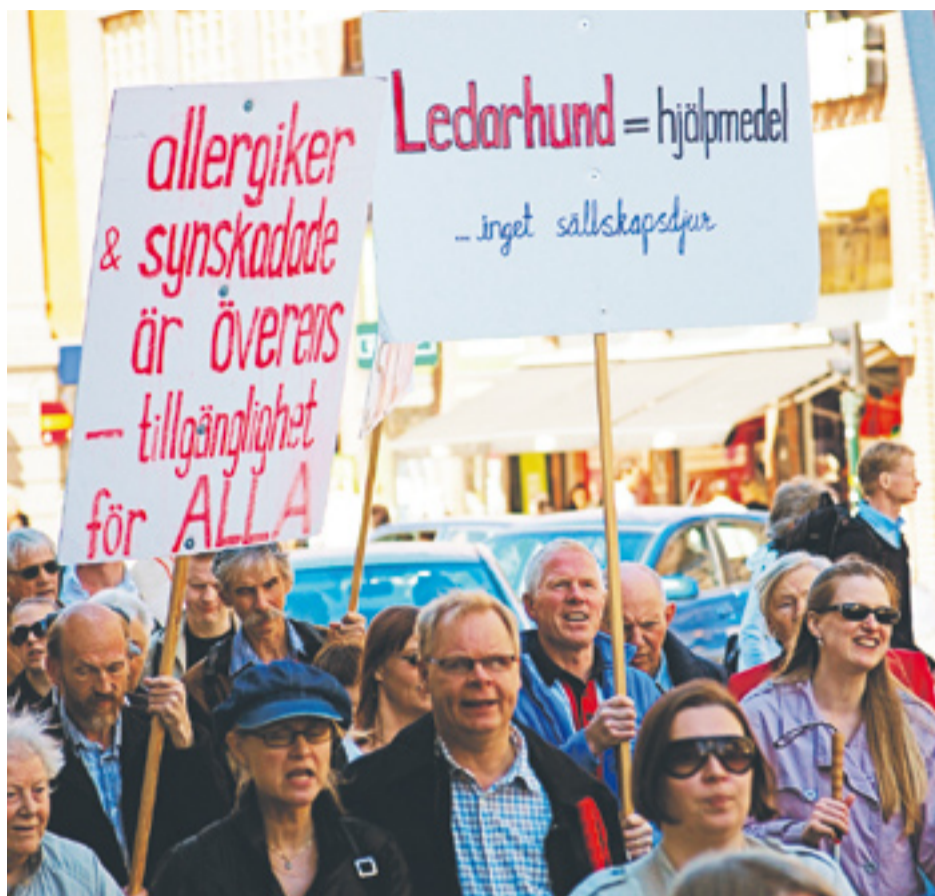
ETT NÄRMEST ORÄKNELIGT antal platser i Sverige är inte möjliga att besöka för människor med någon form av funktionsnedsättning.

Läs- och skrivsvårigheter: 330 000–660 000 personer. ■