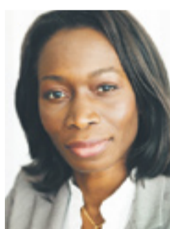
NYAMKO SABUNI lovade nytt förslag senast 2010.

man skedde det samma med de ombudsmän som arbetade mot diskriminering.