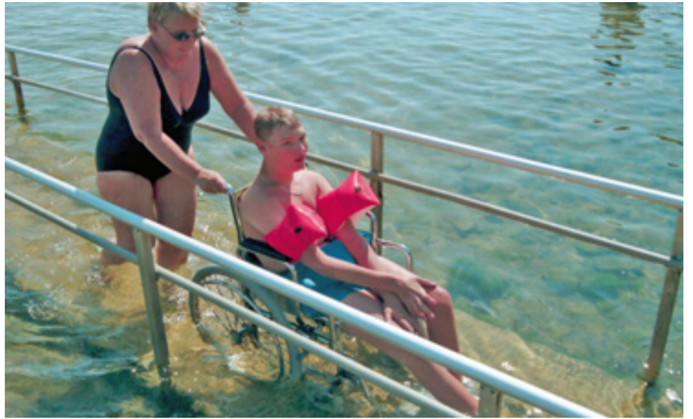
Design för alla är ledordet i Halmstad. Det betyder för till exempel sommarstaden Halmstad att man kan både se fotboll, spela golf, åka gocart, köra travhäst och bada ute, utan att hindras av sin funktionsnedsättning. Barcelona har lyckats ännu bättre, "men vi ska ändra på det", säger kommunens handikappkonsult.

får granska redan färdiga ritningar. Här sitter handikapprepresentanten med vid samma bord från dag ett när byggnadsinspektören, arkitekten och byggherren möts. Frågan om tillgängligheten finns med på banan redan dag ett och följs sedan upp fyra-fem gånger under processen.