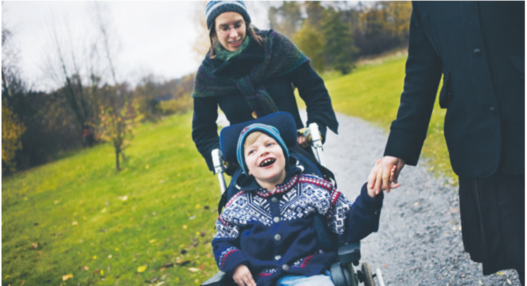
Har man personlig assistans hos Stil är man arbetsledare för sina assistenter. Modellen är unik bland assistansanordnare och självbestämmande och delaktighet är centrala begrepp.